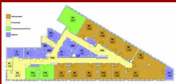
Rozkład poszczególnych pomieszczeń i gabinetów